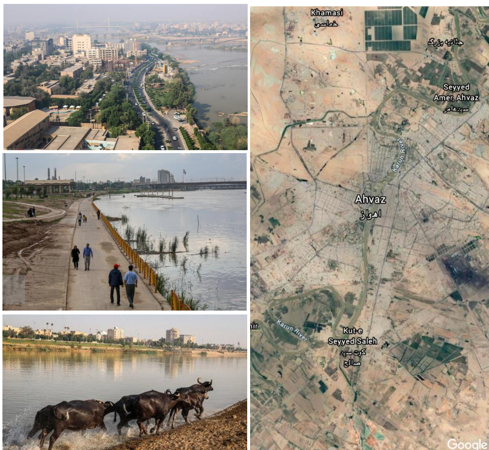
تصویر ۱: تصویر سمت راست؛ محدوده مورد مطالعه، رود کارون شهر اهواز. تصویر ۲، ۳ و ۴: تصویر سمت چپ از بالا به پایین، ساحلی شرقی رود کارون؛ نوار ساحلی کیانپارس غربی (پارک دولت)؛ محدوده گاومیش آباد در سمت جنوب شرقی ساحلی رود کارون.

رودخانه کارون با طولی برابر ۲۲ کیلومتر و با عبور از مرکز شهر اهواز در امتداد شمال شرقی-جنوب غربی، به عنوان یکی از بزرگترین عناصر طبیعی مسلط بر سیمای عمومی شهر تلقی شده و از نظر بصری، روانی و محیط زیست از عوامل با ارزش و تعیین کننده در شکل یابی و طراحی شهری به شمار رفته است. (طرح راهبردی توسعه و عمران (جامع) شهر اهواز، ۱۳۹۰). مسیر ساحلی رود کارون با داشتن قریب به اتفاق تمامی ارکان در تعریف منظر فرهنگی با تاکید بر میراث طبیعی ۳۸ به عنوان یک منظر فرهنگی-طبیعی غنی در کشور ایران محسوب می گردد که از ده سال گذشته در فهرست میراث طبیعی ایران ثبت شده است.